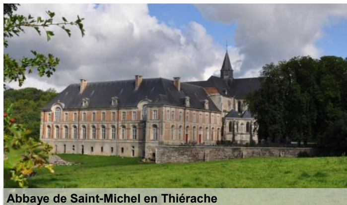
Abbaye de Saint-Michel en Thiérache

La Thiérache est une région proche de chez nous, et pourtant bien souvent méconnue. La discrétion de cette belle contrée n'a d'égal que son charme et sa beauté . Nichée entre les forêts de l'Ardenne au Nord et le plateau de Laon au Sud, elle offre une transition bucolique, façonnée par l'Oise et ses affluents. Ses paysages doucement vallonnés invitent à la promenade et à la quiétude. Car en Thiérache, il faut pouvoir s'émerveiller, s'arrêter pour savourer la tranquillité du lieu ou encore déguster, au cœur d'un hameau ou d'un village, un verre de cidre ou de jus de pommes proposé par un artisan local, à l'ombre d'une église fortifiée.