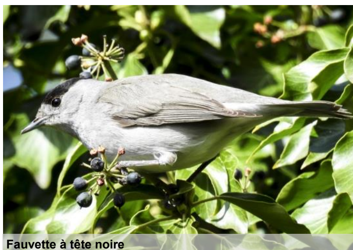
Fauvette à tête noire