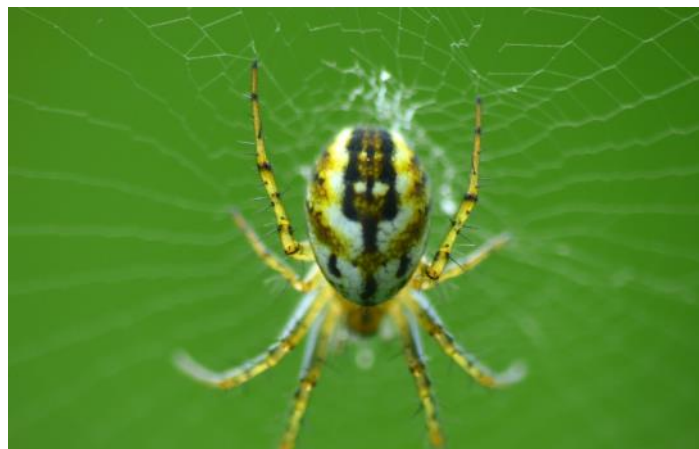
Epeire petite bouteille