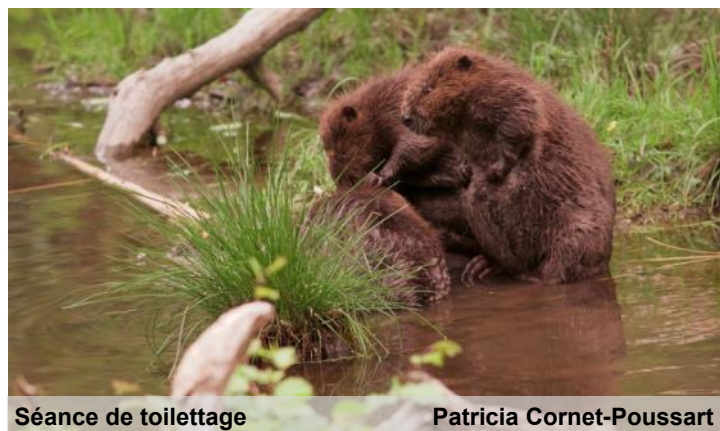
Séance de toilette

Tout au long de la soirée, nous avons pu observer le va et vient des différents membres de la famille (adultes et adolescents). Nous aurons droit à des séances de toilette sur la berge, de grignotages au bord de l'eau, de jeux et poursuites dans l'eau. En fin de soirée, deux des castorins sont apparus devant nous pendant quelques minutes, avant de disparaître aussitôt dans la hutte. »