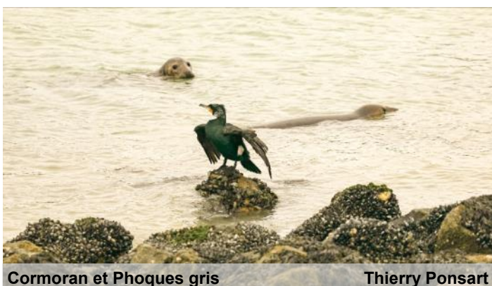
Cormoran et Phoques gris