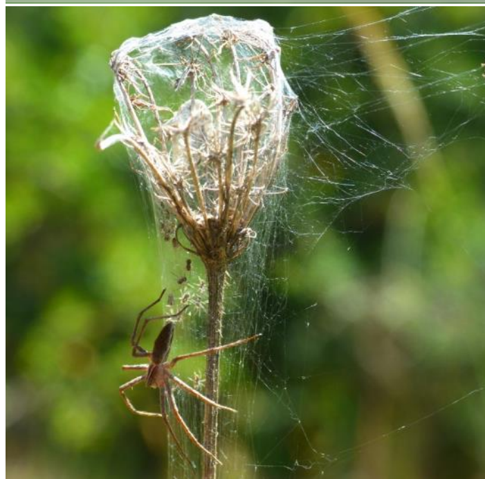
Pisaure admirable avec sa pouponnière Sabrina Mari

douillet qui permettra aux bébés de passer l'hiver, protégés des intempéries, et d'éclore au printemps suivant, alors que les adultes mourront pour la plupart. Certaines espèces aménageront une pouponnière dans leurs appartements.