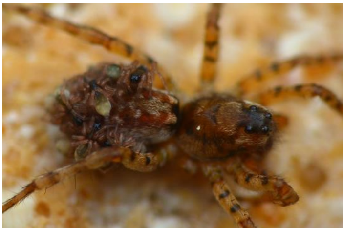
Araignée-loup femelle portant ses petits sur son dos Sabrina Mari

Les comportements maternels sont eux aussi très diversifiés. La femelle d'Epeire, bien visible à la fin de l'été grâce à son abdomen arborant un ventre rond de future maman, ne verra pourtant jamais ses petits. Elle pondra sa progéniture dans un petit cocon