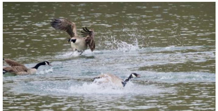
Bernaches du Canada