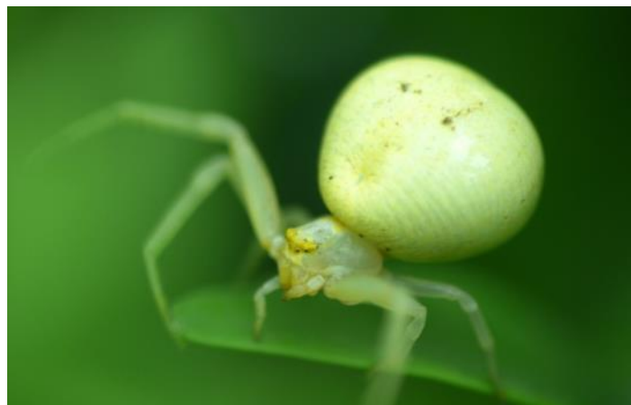
Misumena vatia change de couleur selon le support Sabrina Mari