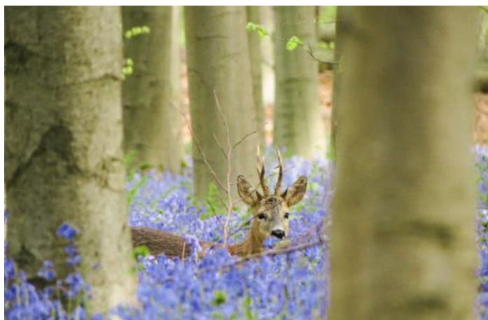
Chevreuril dans les jacinthes en fleurs