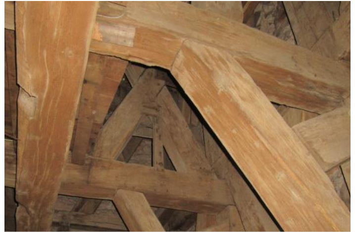
Combles de la basilique de Saint-Hubert