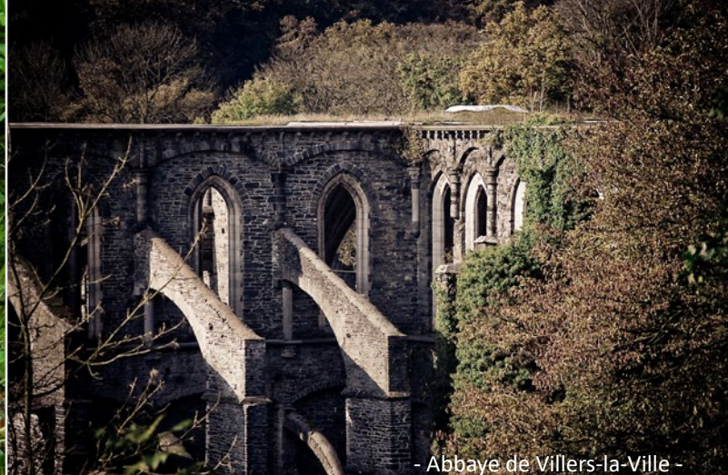
- Abbaye de Villers-la-Ville -