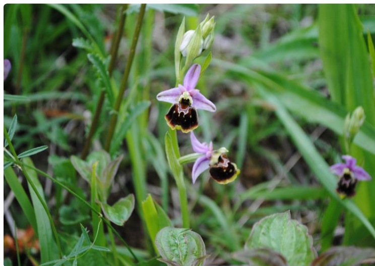
- Ophrys bourdon -