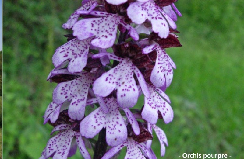
- Orchis pourpre -