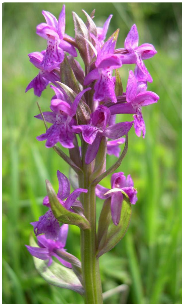
- Orchis de mai -

La pause de midi se fera à l'Aquascope de l'étang de Virelles.