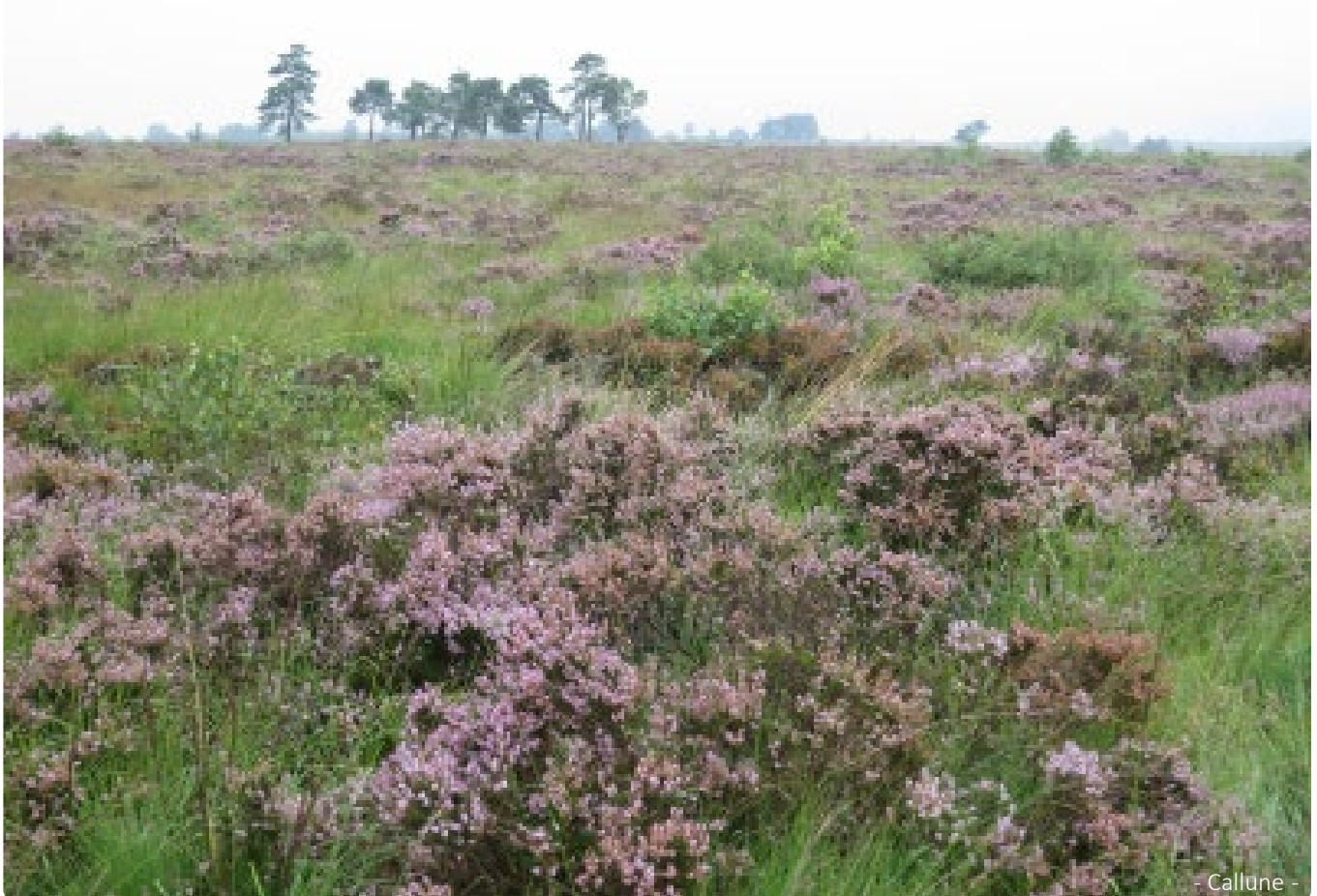
- Callune -

Notre promenade de 10 km nous permettra d'effectuer le grand tour de la Fagne de Malchamps. Nous emprunterons, tout d'abord, les caillebotis afin de traverser de vastes zones tourbeuses. Ces zones humides abritent de nombreuses plantes typiques comme la sphaigne, le drosera, l'andromède, la Linai-grette vaginée ou la Narthécie ossifrage.