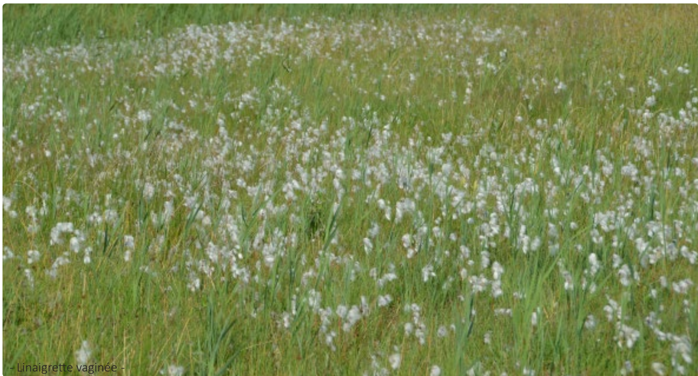
- Linaigrette vaginée -