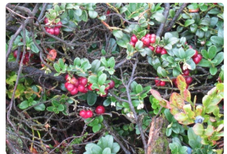
- Airelle -

Notre balade nous mènera ensuite sur le chemin de la Vecquée, une ancienne voie gauloise devenue chaussée romaine. Nous traverserons une succession de landes sèches à Myrtille commune et de landes humides à Bruyère quaternée fréquentées par de nombreuses espèces d'oiseaux comme le Pipit farlouse, le Traquet Pâtre, la Pie grièche grise et même l'Engoulevent d'Europe.