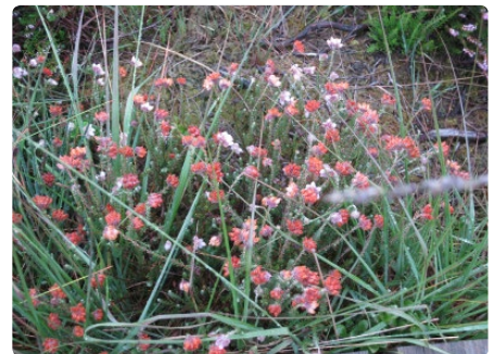
- Bruyère quaternée -

Repas de midi pris à la taverne de l'aérodrome de Spa-La-Sauve-nière (petite restauration, pas de pique-nique autorisé dans l'établis-sement).