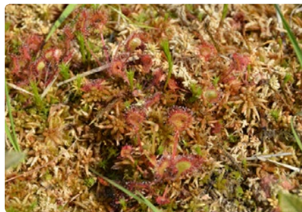
- Drosera -