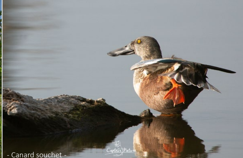
- Canard souchet -