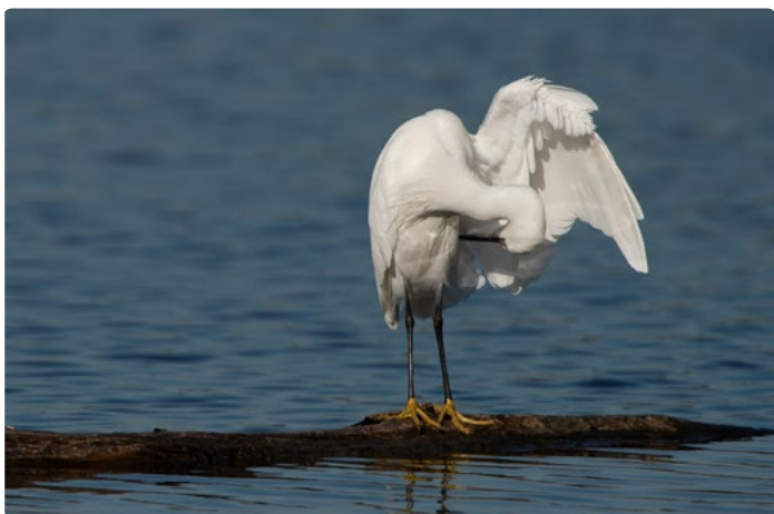
- Aigrette garzette -