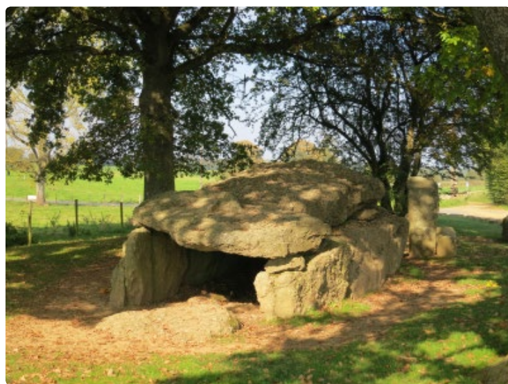
- Dolmen -

Notre balade du jour nous mènera à Wéris. Ce petit village, classé parmi les plus beaux villages de Wallonie, est renommé pour ses sites mégalithiques que sont les dolmens, menhirs ou alignements de pierre. Notre promenade, à travers les campagnes du Pays d'Ourthe et Aisne, nous permettra de comprendre le rôle et la signification de ces mégalithes datant du Néolithique.