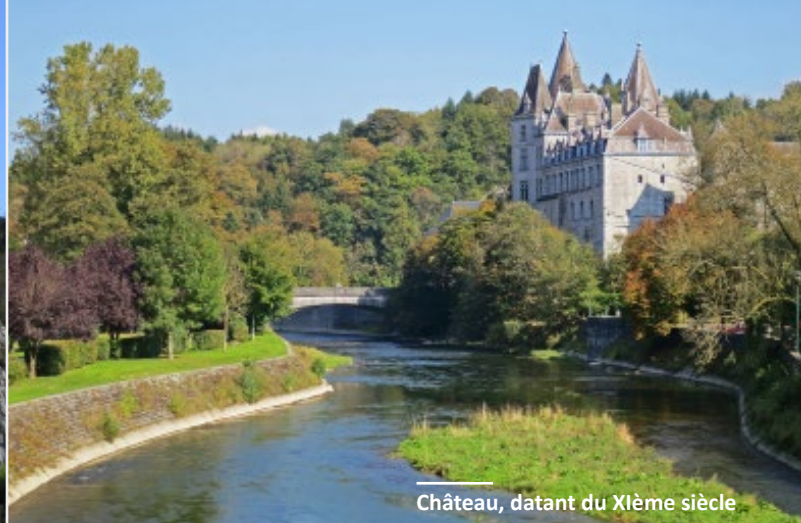
Château, datant du XIème siècle