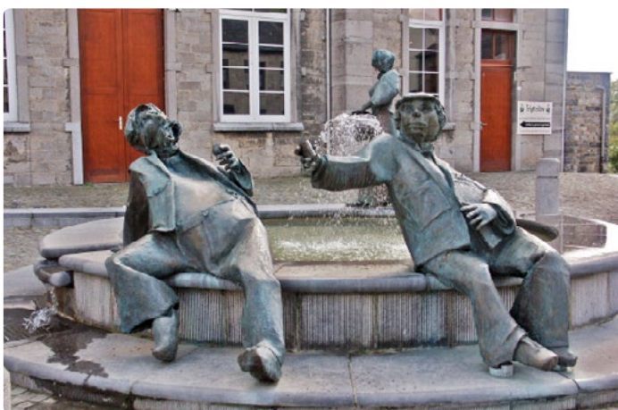
- Espace Arthur Masson -

Cette région nous parlera également de ce pays d'Arthur Masson, écrivain régional qui a si bien décrit ses contemporains. Des traces de l'économie et de l'industrie locale restent imprimées un peu partout : agropastoralisme, industrie métallurgique, extraction de minerais de fer et de chaux.