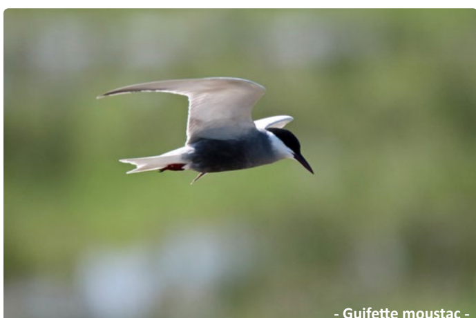
- Guifette moustac -

Le printemps à Ploegsteert attire aussi des limicoles, tels les Chevaliers guinguette, aboyeur, ... et voit passer des rapaces migrateurs dont parfois le magnifique Balbuzard pêcheur. Mais y sont aussi présentes les Gorgebleues à miroir blanc, les Phragmites des joncs et les Rousserolles effarvates, oiseaux dont le chant nous ravira en cette saison des amours.