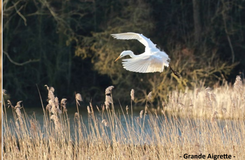
- Grande Aigrette -