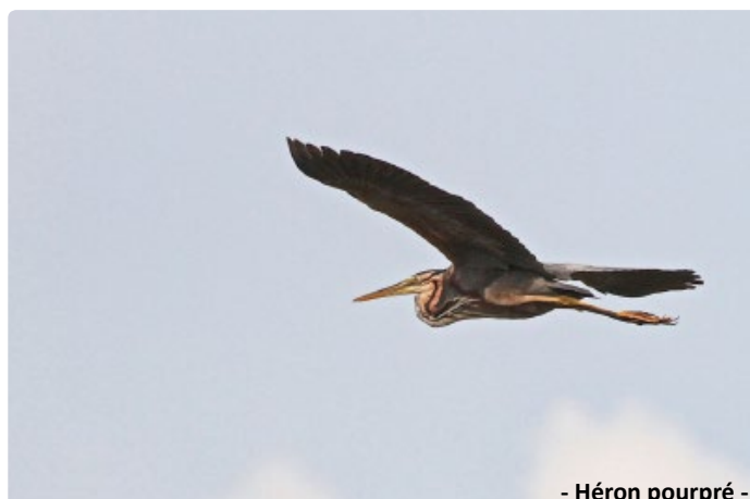
- Héron pourpré -

Les Grèbes huppés, à cou noir et castagneux fréquentent le site même en période de nidification. Les Guifettes noires et moustac y passent en migration, ainsi que la Sterne pierregarin.