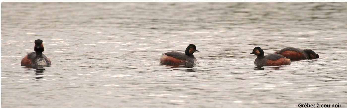
- Grèbes à cou noir -