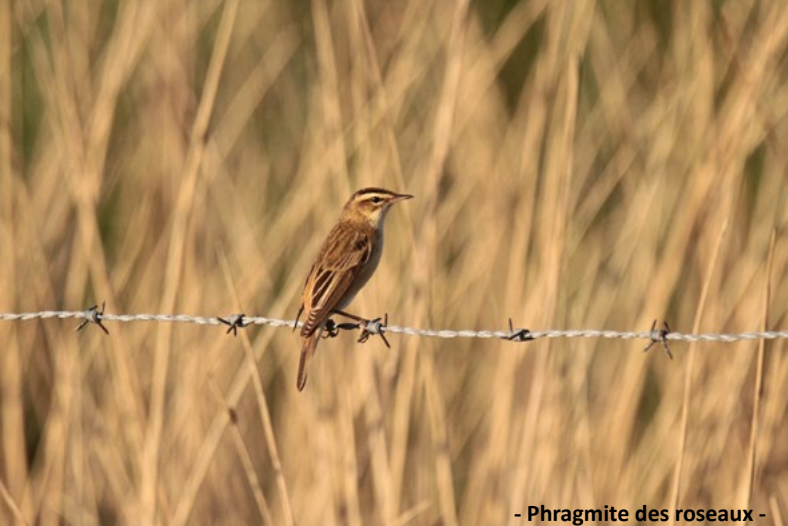
- Phragmite des roseaux -