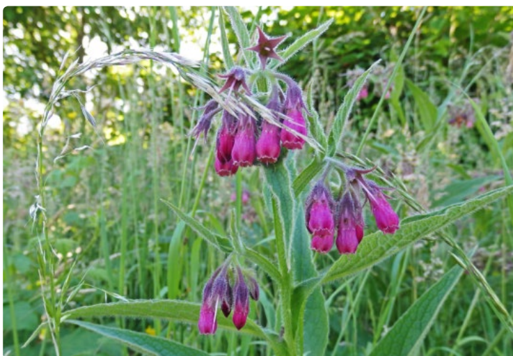
- Consoude -

Cuisiner les plantes sauvages comestibles n'est pas anodin. C'est prendre le temps de se remettre en contact avec la nature , c'est se sentir responsable et sensible à la qualité de notre environnement. C'est se comporter autrement qu'en prédateur ou en consommateur. C'est aussi tout le plaisir de partir avec son panier, au rythme des saisons, glaner, récolter, toucher, humer... et découvrir les qualités gustatives et nutritionnelles de ces «sauvageonnes».