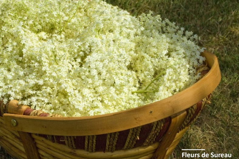
Fleurs de Sureau