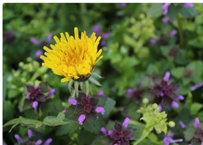
- Pissenlit -