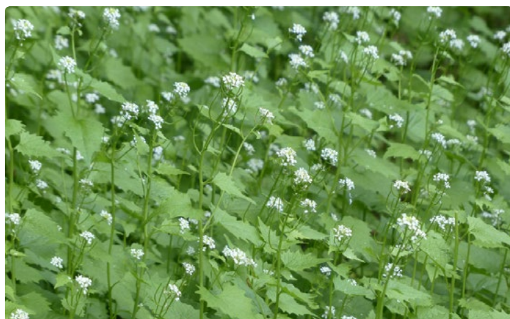
- Alliaire -