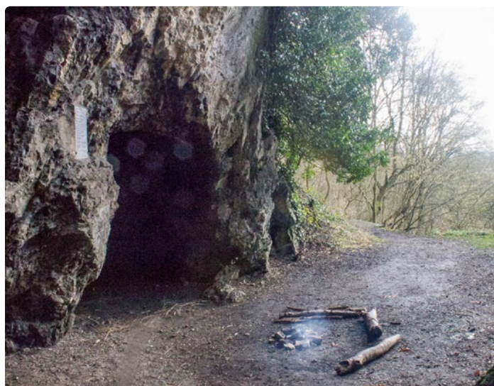
- Grotte de Spy -