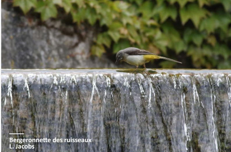
Bergeronnette des ruisseaux L. Jacobs