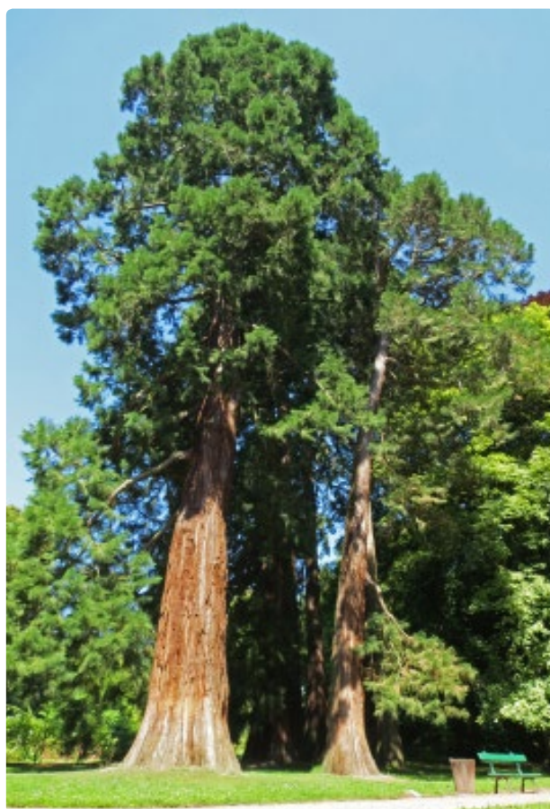
- Séquoias plantés en 1886 -

Aujourd'hui, le Parc de Mariemont possède la plus importante collection dendrologique de la Province de Hainaut avec 2434 plantes dénombrées, dont une septantaine d'arbres remarquables et trente classés comme les plus gros spécimens conservés en Belgique. Il est aussi répertorié comme réserve d'oiseaux. Une remarquable collection de statues de sculpteurs connus tel que Rodin ou Constantin Meunier agrémenteront aussi cette visite.