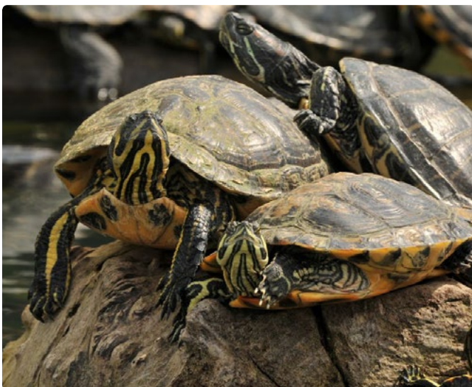
- Tortues de Floride -