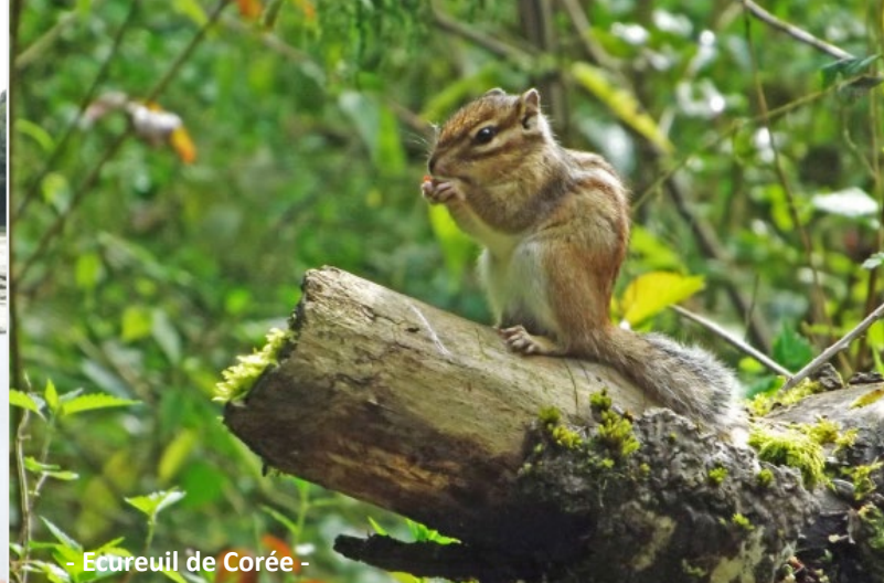
- Ectreuil de Corée -