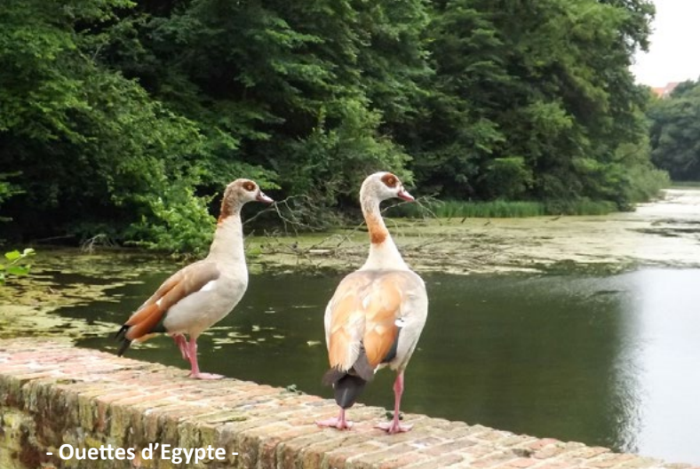
- Ouettes d'Egypte -