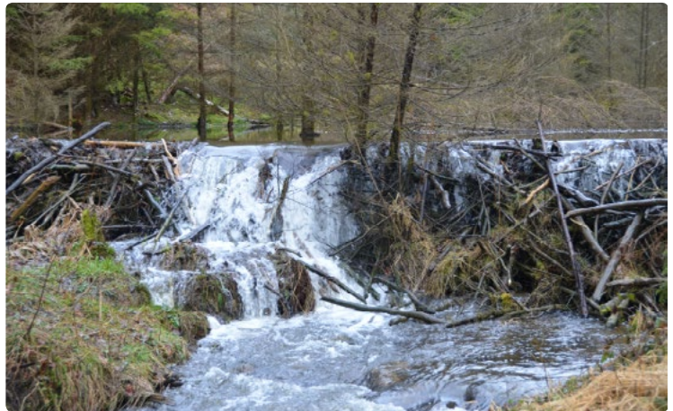
- Barrage -

Sur les petits ruisseaux du bassin de l'Ourthe, ce gros rongeur construit d'impressionnants barrages afin de créer de vastes plans d'eau où il peut se déplacer plus aisément et qui sont favorables à de nombreux poissons, insectes, batraciens et oiseaux d'eau.