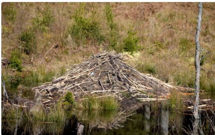
- Hutte -

Jadis dénommé « bièvre » en vieux français, longtemps chassé par l'homme surtout pour sa fourrure, le castor aux moeurs essentiellement nocturnes, vit la journée dans sa hutte qu'il construit en bord de berge ou au milieu de son plan d'eau. Il est essentiellement herbivore. Mais en hiver, il se nourrit de branches stockées près de sa hutte. C'est également à cette période que l'on assiste aux abattages les plus spectaculaires.