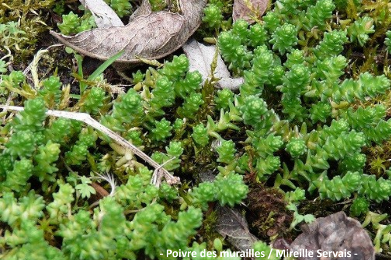
- Poivre des murailles / Mireille Servais -