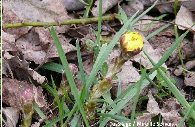
- Tussilage / Mireille Servais -