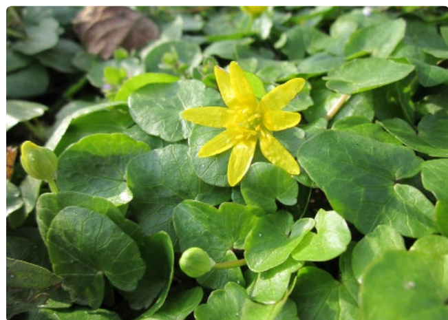
- Ficaire -