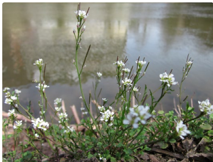
- Cardamine hérissée -

Cuisiner les plantes sauvages comestibles n'est pas anodin. C'est prendre le temps de se remettre en contact avec la nature , c'est se sentir responsable et sensible à la qualité de notre environnement. C'est se comporter autrement qu'en prédateur ou en consommateur. C'est aussi tout le plaisir de partir avec son panier, au rythme des saisons, glaner, récolter, toucher, humer... et découvrir les qualités gustatives et nutritionnelles de ces «sauvageonnes».