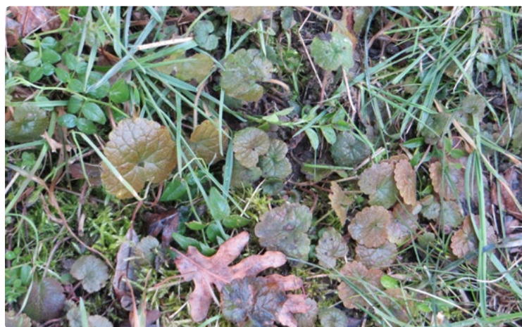
- Lierre terrestre / Fabrice Prestigiacomo -