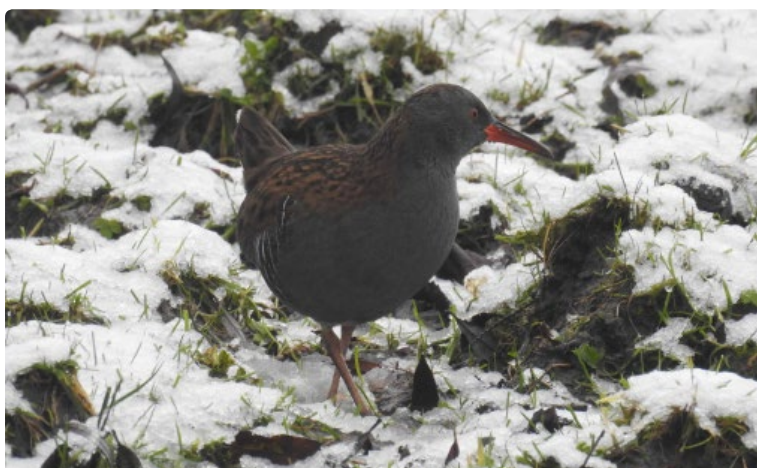
- Râle d'eau -