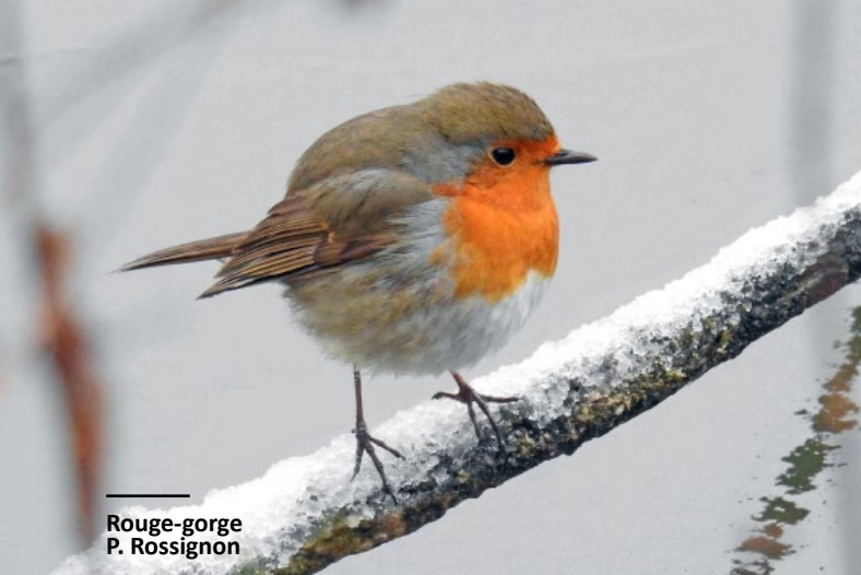
Rouge-gorge P. Rossignon