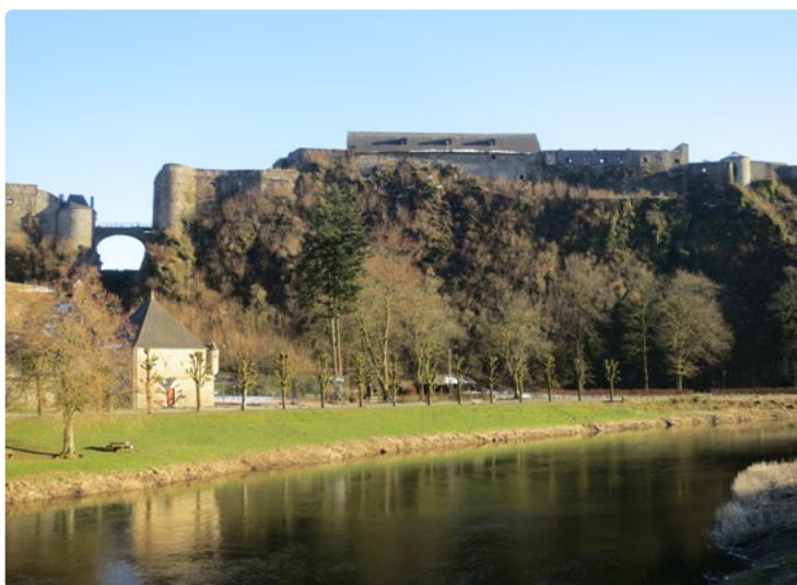
- Le château de Bouillon -

Depuis un millénaire, la cité de Bouillon vit au rythme de son château considéré comme le plus ancien vestige de la féodalité en Belgique et l'une des plus remarquables forteresses d'Europe. Niché sur son éperon rocheux surplombant la Semois, sa construction débuta au VIIIème siècle. Plusieurs modifications furent opérées, au Xème ainsi qu'au XVème par Vauban qui renforça son système défensif.