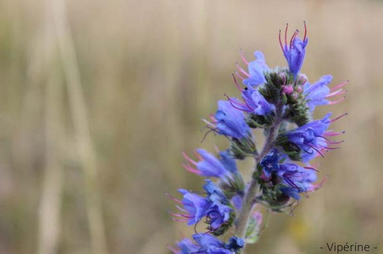
- Vipérine -