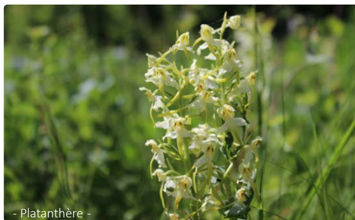
- Platanthère -

Au départ du centre de Belvaux, nous irons à travers bois jusqu'aux rapides de la Lesse. Nous passerons à nouveau par Belvaux pour atteindre les pelouses calcaires de l'autre côté du village. La traversée de ce milieu nous amènera à l'ermitage, où nous pourrions observer toutes les traces de la vie qu'il y eut autrefois.