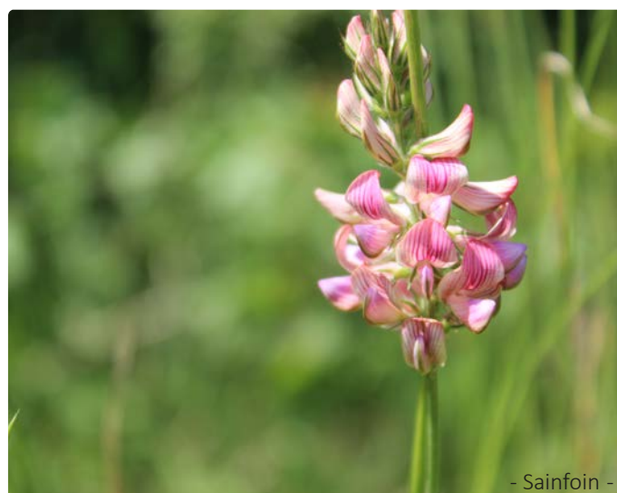
- Sainfoin -

Les décors ne sont pas en reste puisque les rapides de la Lesse sont un lieu où la rivière tente de se créer un passage étroit tant bien que mal, les pelouses calcaires ouvrent un cadre et une diversité qui leur sont propres et l'ermitage se trouve sur une klippe, manifestation géologique particulière.