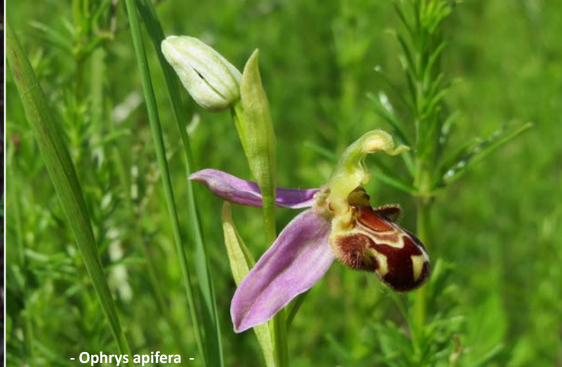
- Ophrys apifera -