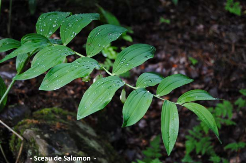
- Sceau de Salomon -