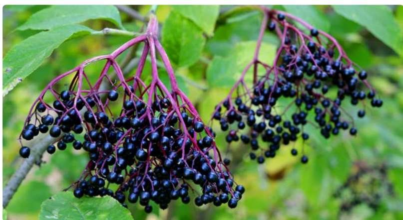
- Sureau noir -