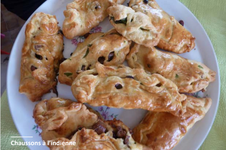
Chaussons à l'indienne