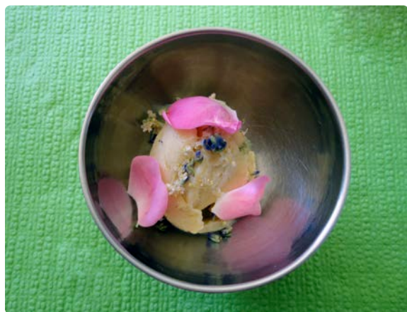
- Glace à la berce -