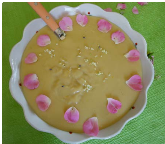
- Crème à la berce -

Nous dégusterons ensemble les plats cuisinés par vos soins , en commençant par un kir à la crème de mûres, et vous repartirez avec un cahier de recettes. Convivialité et gourmandise garanties !