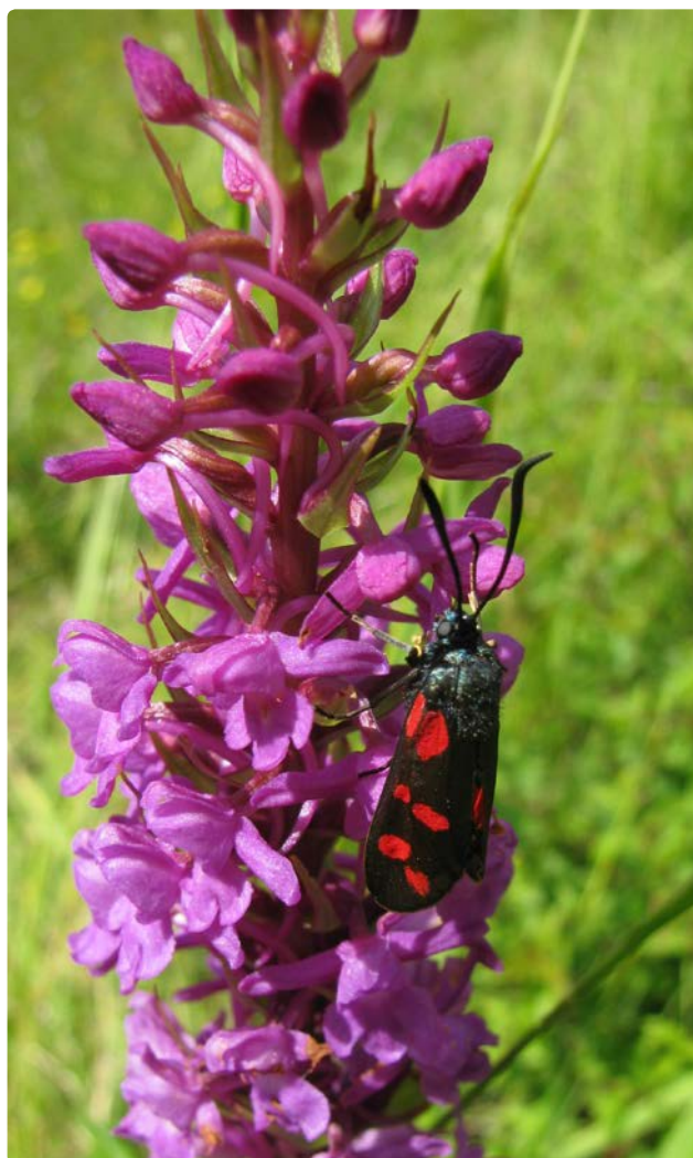
- Orchis moucheur -

La pause de midi se fera à l'Aquascope de l'étang de Virelles.