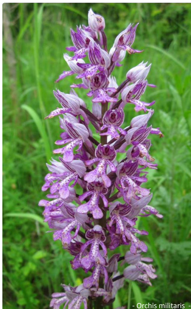
- Orchis militaris -