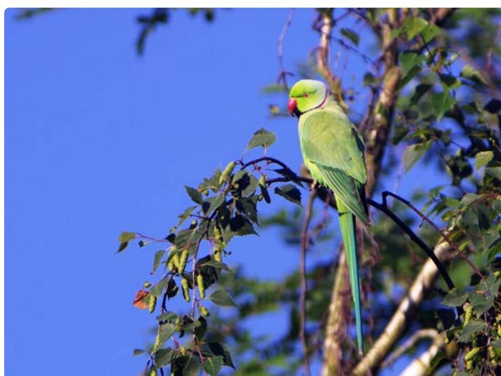
- Perruche à collier -