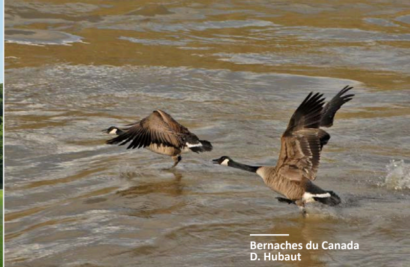
Bernaches du Canada D. Hubaut