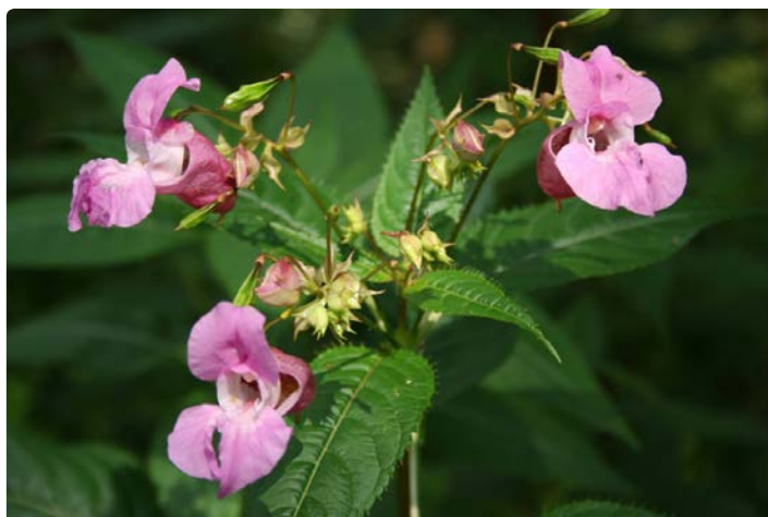
- Balsamine de l'Himalaya -

Nous aurons aussi l'occasion de découvrir des endroits préservés dans une région urbanisée et les espèces indigènes qui y vivent, et de faire le point : faut-il combattre toutes les invasives ?