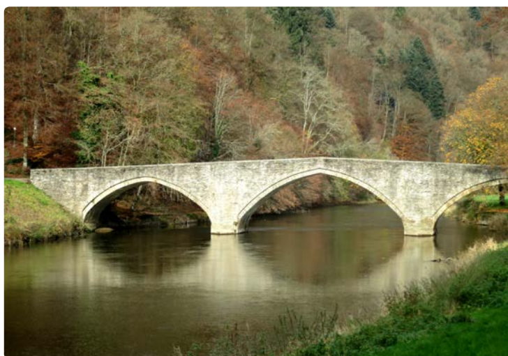
- Le pont de Poulie -

Nous longerons tout d'abord la Semois jusqu'au monastère de Cordemois, nous emprunterons un petit sentier en colimaçon qui nous mènera jusqu'au sommet de la crête. Là, de superbes panoramas sur la cité et la vallée de la Semois s'offriront à nous. Nous rejoindrons notre point de départ en redescendant par un petit chemin en lacets digne des plus beaux itinéraires de montagne.